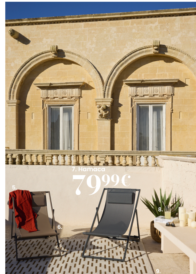
7. Hamaca 7999€

1. Salón de jardín NAPLES. 1 499€ Tejido reciclado. Estructura y patas: aluminio con acabado epoxi de color champán. Respaldo: cuerda 100 % poliéster de color champán. Revestimiento de los cojines del asiento y del respaldo: tela de poliéster 50 % reciclado de 230 g/m 2 , color crudo, funda extraíble e hidrófuga. Relleno de los cojines del asiento: espuma de polietileno, 25 kg/m 3 de densidad, y algodón tejido. Relleno del cojín del respaldo: espuma de polipropileno de 200 g/cm 2 . Mesa baja: Estructura, tablero y patas de aluminio con acabado epoxi de color champán. Dimensiones: 108 x 66 x 29,5 cm. Se recomienda utilizar posavasos y no colocar fuentes de calor sobre el tablero. Anch. 332 x prof. 79,50 x alt. 77 cm. Ref. 251574 - 2. Vaso HELEN. 2,59€ Cristal. Ø 7,80 x alt. 9,50 cm. Ref. 244773 - 3. Bandeja de cocina. 29,99€ Madera con certificado FSC™. Madera. Ø 35 x alt. 5 cm. Ref. 244372 - 4. Vela perfumada COLORAMA. 14,99€ Hecho en Polonia. Cera. Cristal. Acero. Ø 10 x alt. 11 cm. Ref. 241917 - 4. Vela LED LES CLASSIQUES. 12,99€ Cera. Vela LED 10 x 20 cm. Pilas no incluidas. Ø 10 x alt. 20 cm. Ref. 247143