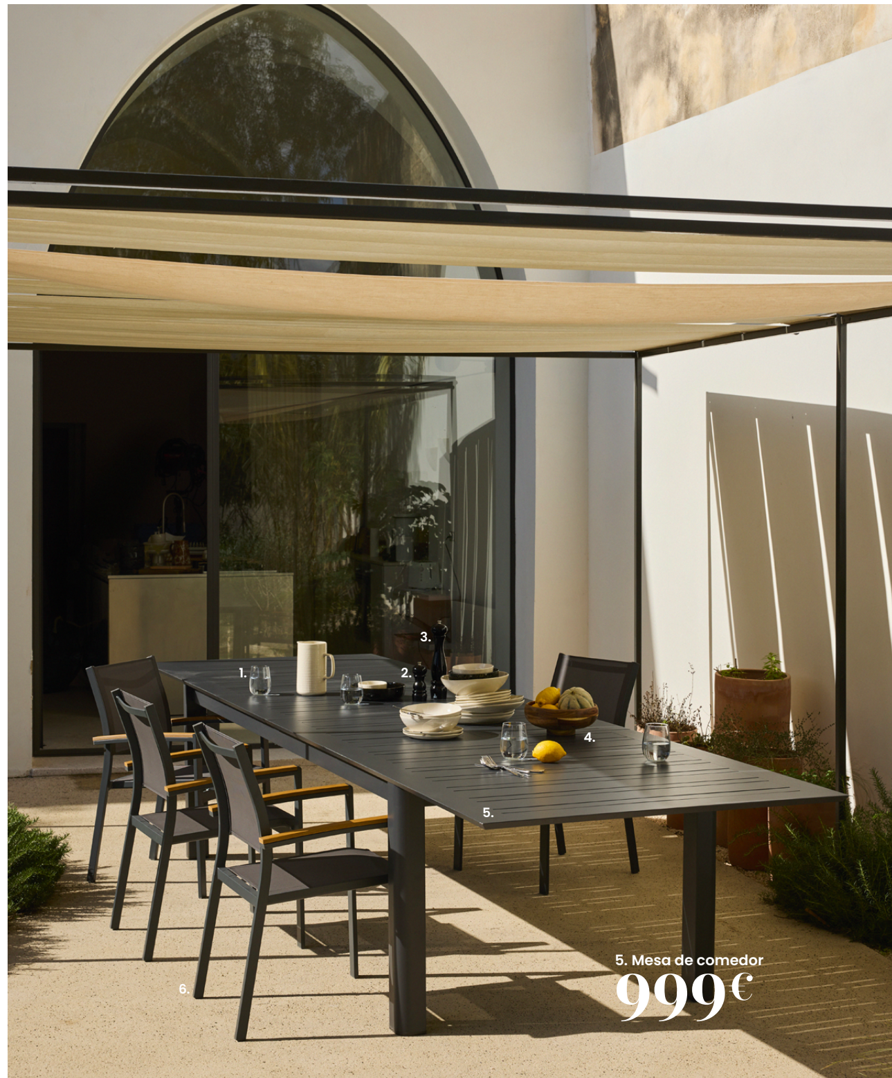
5. Mesa de comedor 999€

1. Vaso. 1,79€ Cristal. Ø 7,80 x alt. 11 cm. Ref. 206715 - 2. Salero y pimentero. 19,99€ Hecho en Francia. Madera. Latón. Ø 6 x alt. 15 cm. Ref. 245953 - 3. Salero y pimentero. 44,99€ Hecho en Francia. Madera. Acero. Ø 6,50 x alt. 30 cm. Ref. 253084 - 4. Copa KULU. 29,99€ Madera con certificado FSC™. Madera. Ø 25 x alt. 10 cm. Ref. 238768 - 5. Mesa de comedor ADELAIDE. 999€ Estructura y patas: acero con acabado epoxi, color gris antracita. Tablero: aluminio, acabado epoxi, color gris antracita. Longitud sin extensión: 2,66 m. Extensión: 2 extensiones tipo mariposa en el centro: 1 que permite pasar de un tablero de 266 a 330 cm y otra que permite pasar de un tablero de 330 a 396 cm. Grosor del tablero: 20 mm. Soporte sin montar. Se recomienda utilizar posavasos y no colocar fuentes de calor sobre el tablero. Anch. 266 x prof. 110 x alt. 75 cm. Ref. 251641 - 6. Silla de comedor FUJI. 69,99€ Otros modelos disponibles. Estructura: aluminio con tratamiento epoxi, color gris antracita. Reposabrazos: material compuesto (HPS, homopolímero de poliestireno), color teca. Revestimiento: tela plastificada 70 % PVC, 30 % poliéster, color antracita. Silla apilable. Anch. 57 x prof. 58 x alt. 86 cm. Ref. 175135