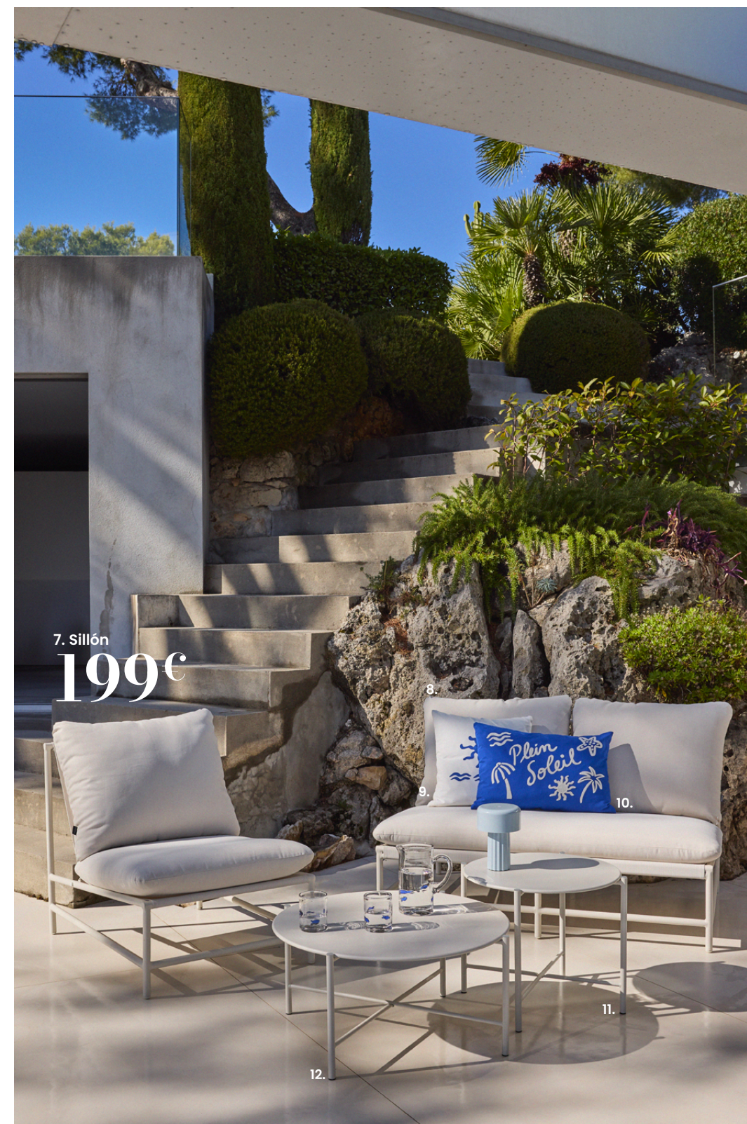
7. Sillón 199€

Nuestra selección responsable: lámpara para exteriores ref 252803, lámpara para exteriores NILS ref 251226, lámpara para exteriores NILS ref 252800.