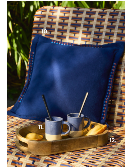
5. Copa LALY. 1,99€ Cristal. Anch. 6,50 x prof. 7 x alt. 20,50 cm. Ref. 113367 – 6. Vaso LALY. 1,59€ Cristal. Ø7 x alt. 8,70 cm. Ref. 119576 – 7. Plato de postre. 6,59€ Otras cerámicas. Ø20 x alt. 2 cm. Ref. 252462 – 8. Plato plano. 8,99€ Hecho en Portugal. Gres. Anch. 26,80 x prof. 3 x alt. 26,80 cm. Ref. 251935 – 9. Servilletas. 9,99€ Algodón orgánico. Conjunto de 4. Otros modelos disponibles. 100 % algodón ecológico. Anch. 40 x alt. 40 cm. Ref. 240563 – 10. Funda de cojín. 12,99€ Colores surtidos. Otros modelos disponibles. 100 % algodón. Anch. 40 x alt. 40 cm. Ref. 252230 – 11. Juego de tazas. 19,99€ Conjunto de 6. Otras cerámicas. Anch. 21,50 x prof. 15 x alt. 7 cm. Ref. 249888 – 12. Bandeja decorativa. 16,99€ Madera con certificado FSC™. Madera. Anch. 30 x prof. 17 x alt. 4 cm. Ref. 207927 – 13. Salón de jardín SAO ANTAO. 349€ Otros modelos disponibles. Sillones (x2): estructura y patas de acero con acabado epoxi de color terracota. Revestimiento: resina de polietileno 50 % reciclada, multicolor, resistente al agua y a los rayos ultravioleta. Altura del asiento: 38 cm. Apilable. Mesa baja: estructura y patas de acero con acabado epoxi de color terracota. Anch. 72 x prof. 70 x alt. 76,50 cm. Ref. 251528 – 14. Farol LED solar. 49,99€ Acero. Ø30,50 x alt. 32,50 cm. Ref. 251841 – 15. Farol LED solar. 34,99€ Acero. Ø24,50 x alt. 26,50 cm. Ref. 251838 – 16. Alfombra exterior. 99,99€ Polietileno. 100 % polipropileno. Anch. 140 x alt. 200 cm. Ref. 252873