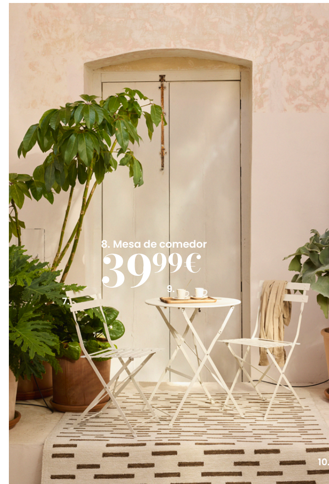
8. Mesa de comedor 399€

1. Vaso. 1,79€ Cristal. Ø 7,80 x alt. 11 cm. Ref. 206715 - 2. Salero y pimentero. 19,99€ Hecho en Francia. Madera. Latón. Ø 6 x alt. 15 cm. Ref. 245953 - 3. Salero y pimentero. 44,99€ Hecho en Francia. Madera. Acero. Ø 6,50 x alt. 30 cm. Ref. 253084 - 4. Copa KULU. 29,99€ Madera con certificado FSC™. Madera. Ø 25 x alt. 10 cm. Ref. 238768 - 5. Mesa de comedor ADELAIDE. 999€ Estructura y patas: acero con acabado epoxi, color gris antracita. Tablero: aluminio, acabado epoxi, color gris antracita. Longitud sin extensión: 2,66 m. Extensión: 2 extensiones tipo mariposa en el centro: 1 que permite pasar de un tablero de 266 a 330 cm y otra que permite pasar de un tablero de 330 a 396 cm. Grosor del tablero: 20 mm. Soporte sin montar. Se recomienda utilizar posavasos y no colocar fuentes de calor sobre el tablero. Anch. 266 x prof. 110 x alt. 75 cm. Ref. 251641 - 6. Silla de comedor FUJI. 69,99€ Otros modelos disponibles. Estructura: aluminio con tratamiento epoxi, color gris antracita. Reposabrazos: material compuesto (HPS, homopolímero de poliestireno), color teca. Revestimiento: tela plastificada 70 % PVC, 30 % poliéster, color antracita. Silla apilable. Anch. 57 x prof. 58 x alt. 86 cm. Ref. 175135