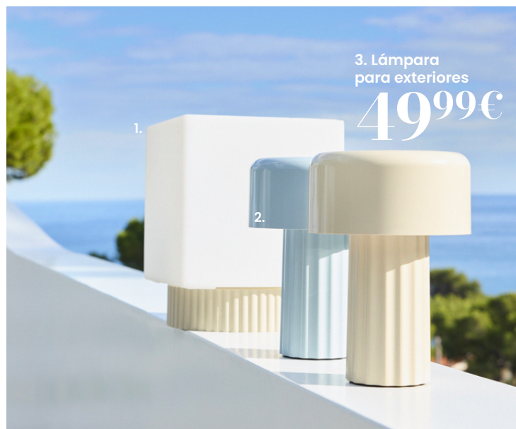
3. Lámpara para exteriores 49,99€

1. Lámpara para exteriores. 79,99€ Hecho en España. Polietileno. Plástico ABS. Bombilla LED portátil recargable por USB. Anch. 20 x prof. 20 x alt. 25 cm. Ref. 252803 - 2. Lámpara para exteriores NILS. 49,99€ Hecho en España. Otros modelos disponibles. Plástico ABS. Lámpara inalámbrica táctil y recargable por USB. Ø14 x alt. 20 cm. Ref. 251226 - 3. Lámpara para exteriores NILS. 49,99€ Hecho en España. Otros modelos disponibles. Plástico ABS. Lámpara inalámbrica táctil y recargable por USB. Ø14 x alt. 20 cm. Ref. 252800 - 4. Jarra. 24,99€ Cristal. Anch. 17 x prof. 10 x alt. 20 cm. Ref. 252743 - 5. Decoración. 9,99€ Loza. Anch. 17,50 x prof. 2,50 x alt. 16,40 cm. Ref. 251876 - 6. Vaso. 5,99€ Cristal. Ø8 x alt. 10 cm. Ref. 252747 - 7. Sillón LECCI. 199€ Tejido reciclado. Estructura: aluminio, acabado epoxi, color arcilla. Revestimiento: textilene 70 % PVC + 30 % poliéster, color arcilla. Revestimiento del cojín del asiento y del respaldo: funda de poliéster reciclado, resistente al agua y desenfundable, color arcilla. Relleno del cojín del asiento y del respaldo: espuma de poliuretano de 25 kg/m 3 de densidad. Altura del asiento: 45 cm. Anch. 65 x prof. 90 x alt. 74 cm. Ref. 251635