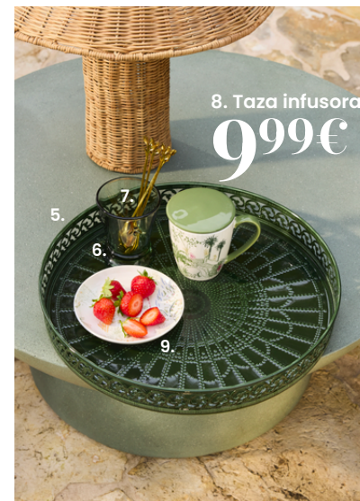
8. Taza infusora 9,99€