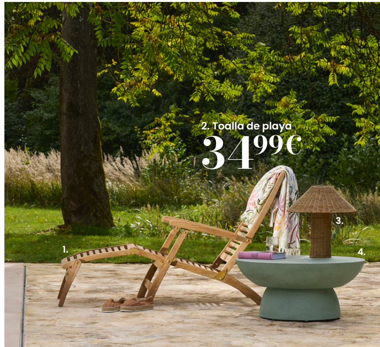
2. Toalla de playa 34,99€