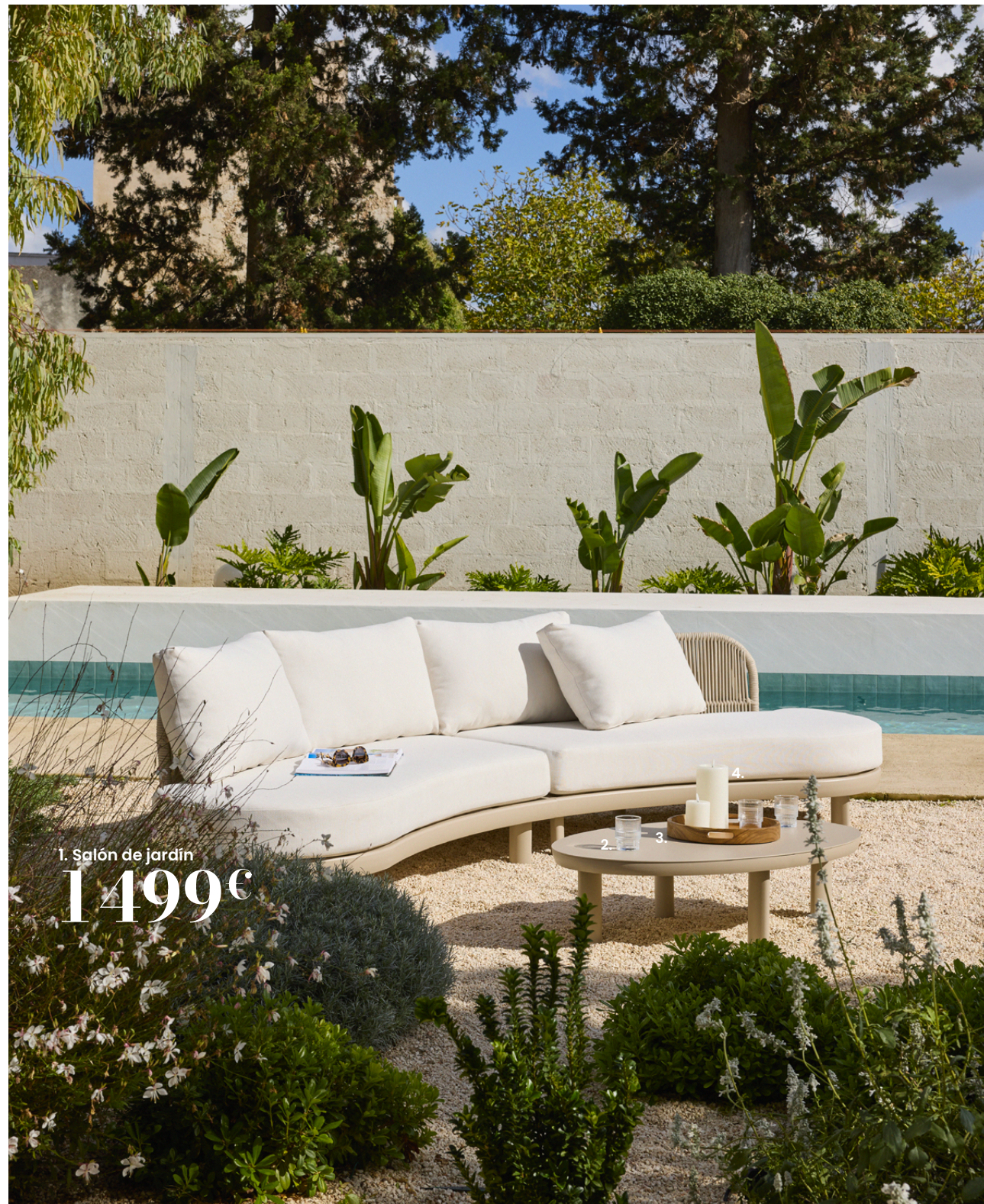
1. Salón de jardín 1499€

1. Salón de jardín NAPLES. 1 499€ Tejido reciclado. Estructura y patas: aluminio con acabado epoxi de color champán. Respaldo: cuerda 100 % poliéster de color champán. Revestimiento de los cojines del asiento y del respaldo: tela de poliéster 50 % reciclado de 230 g/m 2 , color crudo, funda extraíble e hidrófuga. Relleno de los cojines del asiento: espuma de polietileno, 25 kg/m 3 de densidad, y algodón tejido. Relleno del cojín del respaldo: espuma de polipropileno de 200 g/cm 2 . Mesa baja: Estructura, tablero y patas de aluminio con acabado epoxi de color champán. Dimensiones: 108 x 66 x 29,5 cm. Se recomienda utilizar posavasos y no colocar fuentes de calor sobre el tablero. Anch. 332 x prof. 79,50 x alt. 77 cm. Ref. 251574 - 2. Vaso HELEN. 2,59€ Cristal. Ø 7,80 x alt. 9,50 cm. Ref. 244773 - 3. Bandeja de cocina. 29,99€ Madera con certificado FSC™. Madera. Ø 35 x alt. 5 cm. Ref. 244372 - 4. Vela perfumada COLORAMA. 14,99€ Hecho en Polonia. Cera. Cristal. Acero. Ø 10 x alt. 11 cm. Ref. 241917 - 4. Vela LED LES CLASSIQUES. 12,99€ Cera. Vela LED 10 x 20 cm. Pilas no incluidas. Ø 10 x alt. 20 cm. Ref. 247143