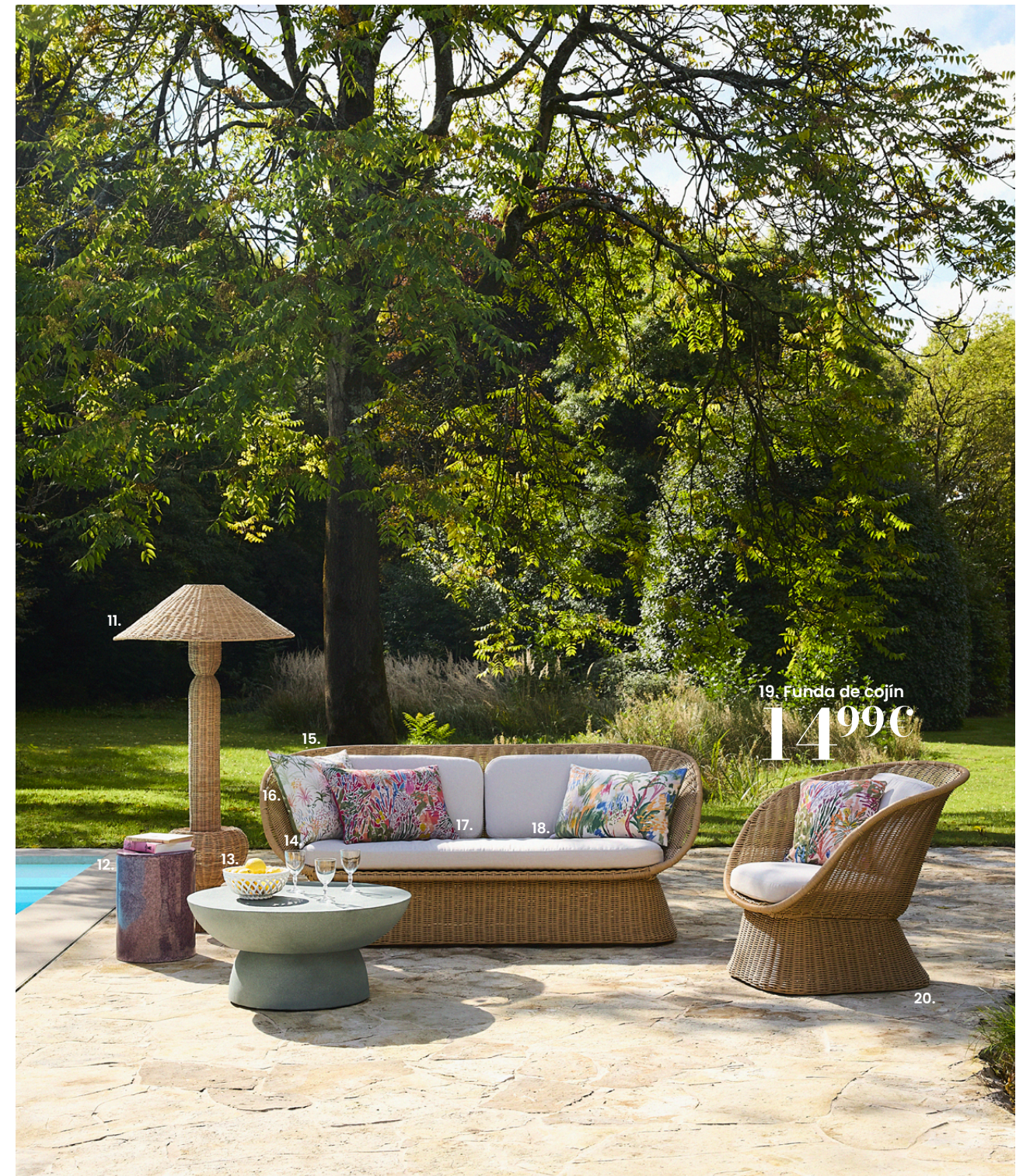
19. Funda de cojín 14,99€

Nuestra selección responsable: chaise longue OLERON ref 50030001, lámpara para exteriores ref 251257, vaso ref 252865, hamaca PANAMA ref 238207, lámpara de pie de exterior ref 251256, copa GLORIA ref 126748.