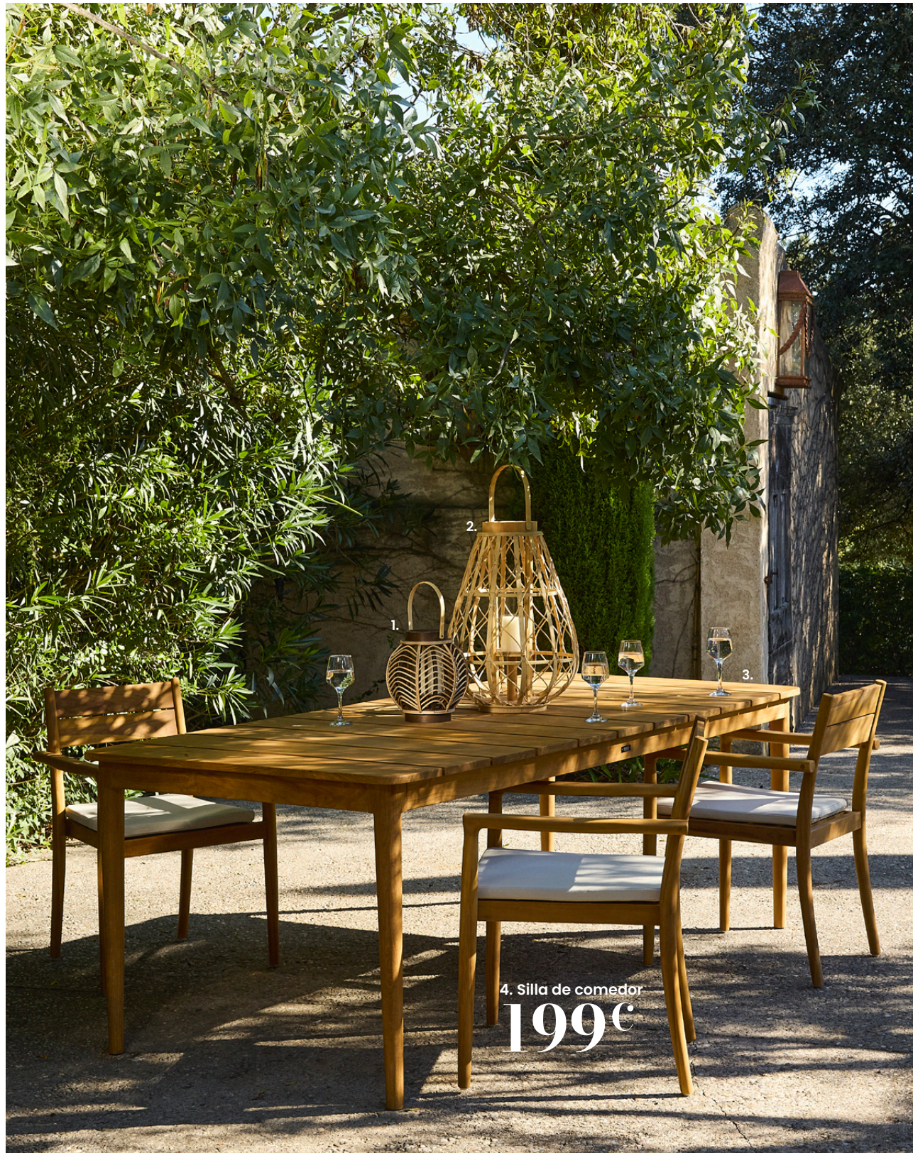
1. Farol. 29,99€ Madera. Cristal. Ø21x alt. 25 cm. Ref. 244541 – 2. Farol. 49,99€ Bambú. Cristal. Contrachapado. Ø38 x alt. 54,50 cm. Ref. 189846 – 3. Mesa de comedor AMANCE. 799€ Madera con certificado FSC™. Estructura, patas y tablero de teca maciza con certificado FSC™. Acabado: composición de base acuosa. Se recomienda utilizar posavasos y no colocar fuentes de calor sobre el tablero. Anch. 220 x prof. 100 x alt. 76 cm. Ref. 251262 – 4. Silla de comedor AMANCE. 199€ Madera con certificado FSC™. Estructura, asiento y patas de teca con certificado FSC™ y acabado aceitado. Revestimiento del cojín del asiento de poliéster y olefina de color cruda, funda hidrófuga y extraíble. Relleno del cojín del asiento de espuma de poliuretano (28 kg/m³ de densidad), 3 cm de grosor. Altura del asiento: 46 cm. Anch. 57 x prof. 57 x alt. 82 cm. Ref. 246063