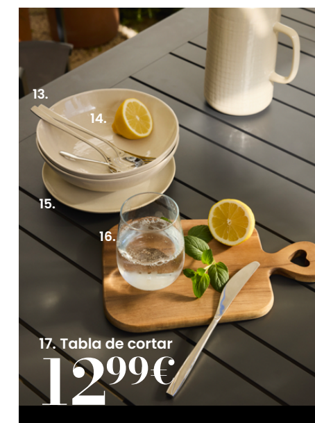
17. Tabla de cortar 1299€

Nuestra selección responsable: vela perfumada COLORAMA ref 241917, manta ref 236017.